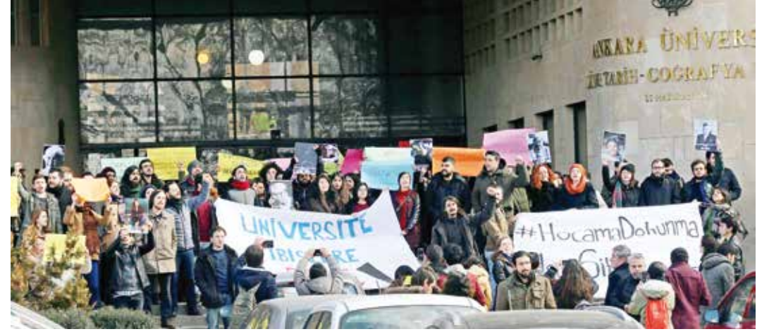
Akademisyen ihraçları ülkenin dört bir yanında protesto ediliyor.