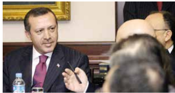
16 Aralık 2004, Brüksel. Erdoğan, başbakan olduğu dönemde Avrupa Birliği görüşmelerinden sonra basın sorularını yanıtlıyor.

- Otoriterlerin repertuarı çok kısıtlıdır. Ulusal güvenliğe tehdit, vatana ihanet, terörizm suçlamaları gibi... Mesela gazeteci Hasan Cemal bile terör propagandasıyla suçlanmış. Çin'deki ve Doğu Avrupa'daki aktivistlerin bir ilkesi var: "Sanki öylemişçesine" diye bir ilke... Sanki özgür bir ülkede yaşıyormuş gibi davranıyorlar. Her şeye bıkmadan usanmadan "Bu insan haklarına, demokrasiye aykırıdır" diye itiraz ediyorlar. Sonuç alamayacağını bilseler bile topluma mesaj vermeye devam ediyorlar. Bir tenis maçı gibi... "Ben bu maçı üç sette bitiririm" dersin, enerjini yanlış harcar ve maçı kaybedersin. Ama Roger Federer gibi bakar, bu iş beş set, beş saat sürecek diye planlarsan mental olarak daha güçlü olursun.