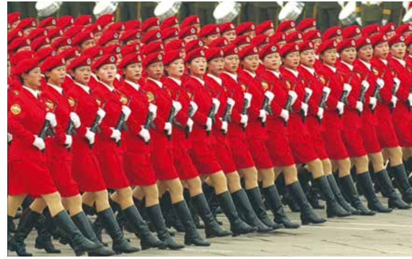
Çin ordusundaki kadın askerler, Çin Halk Cumhuriyeti 50'nci yıl etkinliklerinde...