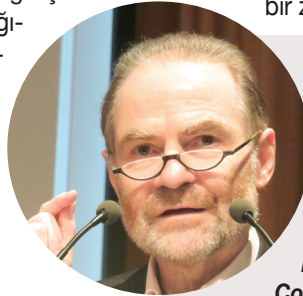
Timothy Garton Ash

Özgür ifadenin temel işlevi Garton Ash'e göre gerçeği ortaya çıkartmak. Gerçeklerin gizlenebileceğini, üzerinin örtülebileceğini ama hiçbir zaman yok edilemeyeceğine dikkat çeken İngiliz tarihçi, gerçeği ortaya çıkartacak tek unsurun ifade özgürlüğü olduğunu altını çiziyor. Kentleşme ve internetin yayılmasıyla birlikte dünyanın "küresel boyutta bir kent" haline geldiğini belirten Garton Ash, bu gelişimin özgür ifade olasılıklarını arttırdığını, ancak aynı zamanda yeni sorunlara zemin hazırladığını ifade ediyor. Örneğin internette yayınlanan bir video bir ülkede yalnızca itici ve rencide edici bulunurken başka bir ülkede,, protestolara ve şiddet olaylarına yol açabiliyor.