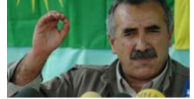
Kararılan konuştu: Kobani'de son durum