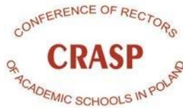
Conference of Rectors of Academic Schools in Poland